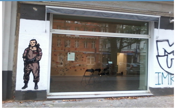
Exteriör Errant Bodies, Kollwitzstrasse 97, Berlin

Tittytainment är en term som myntades av Zbigniew Brzezinski, National Security advisor åt USA:s tidigare president Jimmy Carter, i huvudsak för att sprida idén om en mix av "bedövande underhållning och tillräcklig näring" som kan "lugna den frustrerade befolkningen i världen". Begreppet uppstod under det berömda "State of the World Forum" som hölls på San Francisco's Fairmont Hotel år 1995. Den här idén presenterades som lösningen på förverkligandet av det "20/80-samhälle" man ville uppnå under 2000-talet.